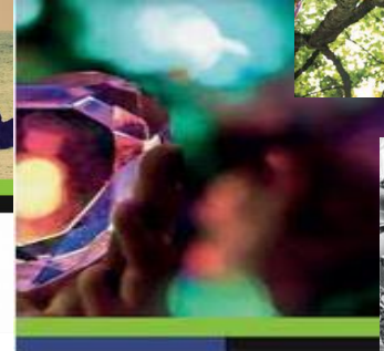
BIJZONDER GEVORMD Over vorming in het christelijk onderwijs