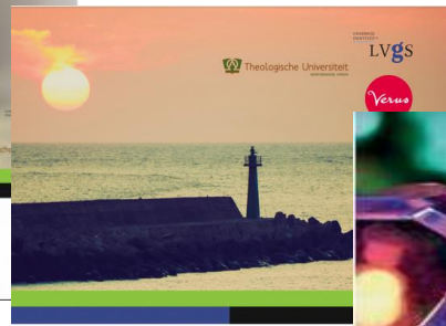
SCHOLEN IN DE RUIMTE VAN GODS KONINKRIJK Een theologie voor christelijk onderwijs