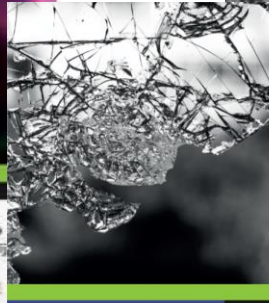
LEREN LEVEN MET H... De betekenis van zonde, kwaad en... in onderwijs en pedagogie