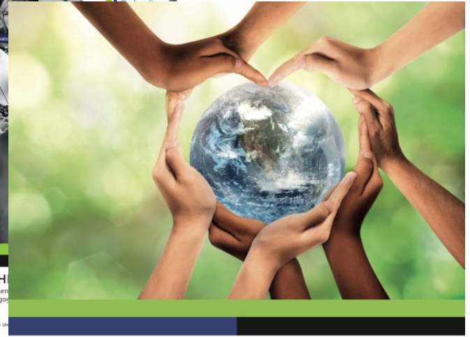
WERELDVERBETERAARS Burgerschapsonderwijs op de christelijke school